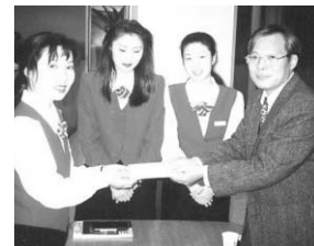
▲ 여직원회의 후원금 전달 모습. 당시 여직원회의 힘은 막강했습니다!