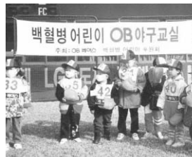
▲ 지금은 두산베어스, 20년 전에는 OB베어스! 마스크를 쓴 꼬마 선수들의 야구 클럽 킥 모습이 앙증맞습니다.