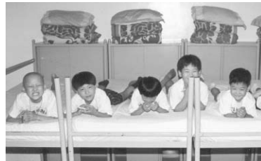
▲ 가족캠프에 참여한 어린이들의 모습! 함께 뭉굴거리는 아이들, 지금쯤 20대 후반? 30대? 어른으로 자라 있겠네요! 어디 계세요? 손들어 주세요~!