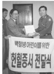
▲ 헌혈의 든든한 동반자는 그 때도 지금도 군인 아저씨입니다.