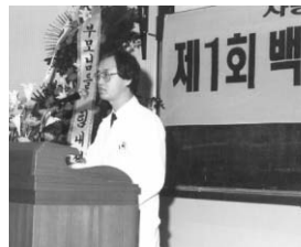
▲ 제1회 백혈병 어린이를 위한 모임에서 의료진의 말씀, 제1회의 글이 선명하네요!

5. 기 타 위에 예시한 사업뿐 아니라 백혈병 어린이들의 완전한 치료를 위한 현행 의료보험제도(180일로 제한되어 있는 의료보험 사용일수를 365일로 연장)의 개선 및 의료행정의 문제점을 개선하는 운동, 아이들에게 격려의 카드 보내기 운동, 아이들이 소망하는 소원들 어주기 운동 등의 사업을 펼쳐 나가기로 계획하고 있습니다.