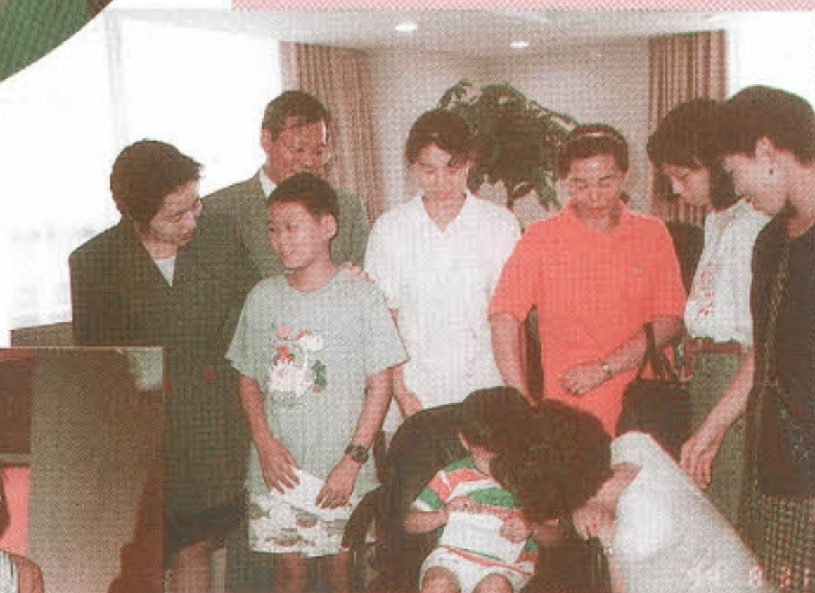
▶ 제일기획 상미회 -재석아 꼭 나아야돼!-