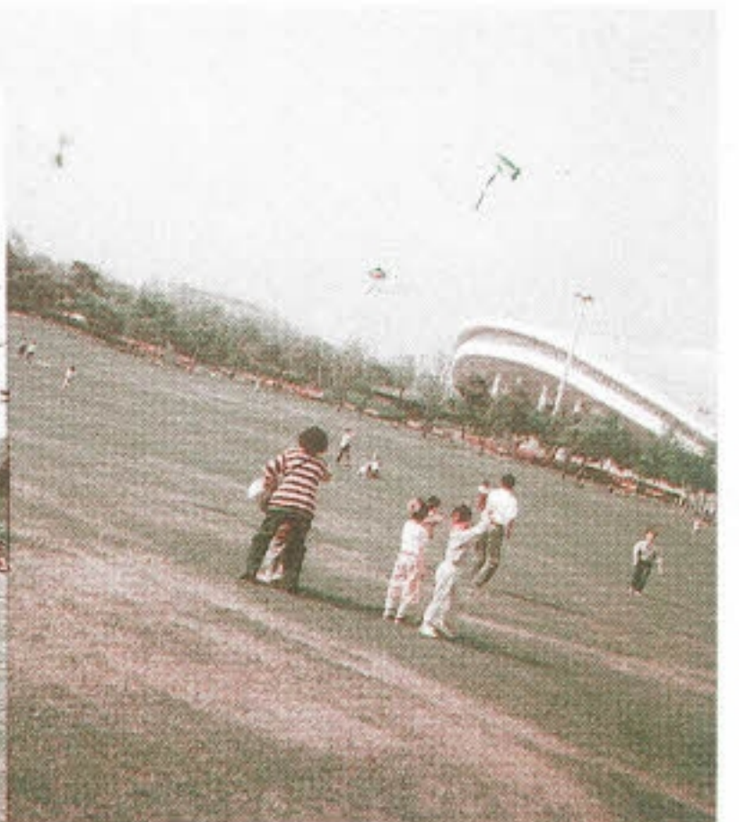
▶ 연날리기 대회 - 나을 수 있어요. 날 수 있어요.