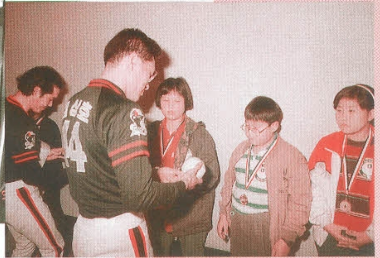
▶ 우리 같이 힘내자 - OB베어스 선수단