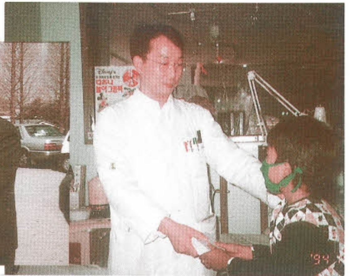
▶ 사랑의 헌혈 증서를 주치의의를 통하여 백혈병어린이에게 전달