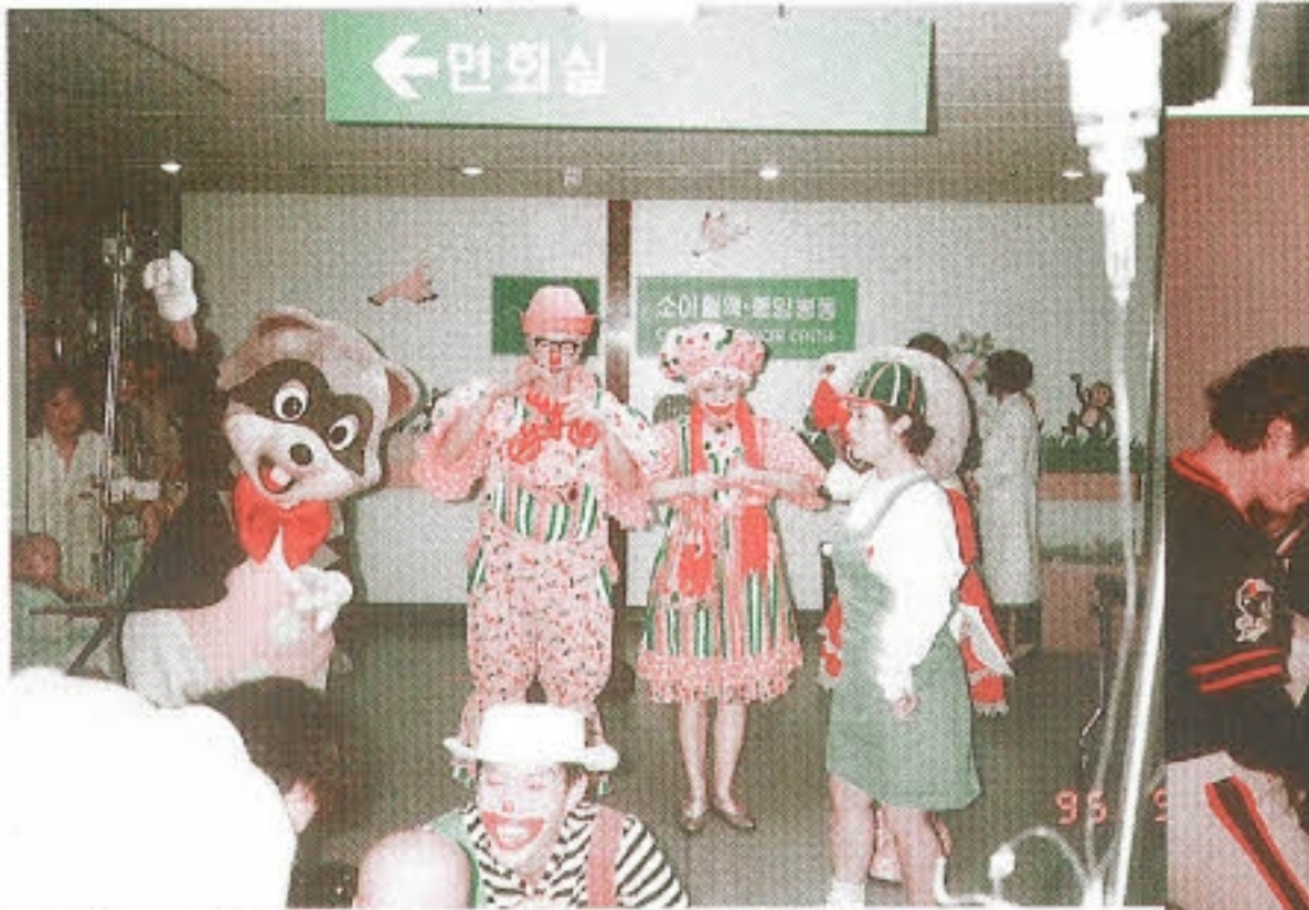
▶ 자 크게 웃어요 그리고 춤을 춰봐요 - 롯데월드 마스코트 서울대학병원 어린이병원 방문