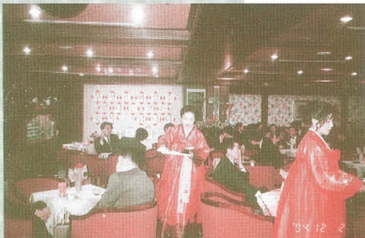
▶ 무엇을 바칠수 있다는 것은 축복입니다. - 주택은행 상록수회