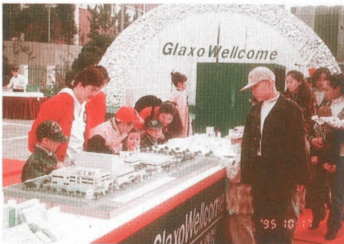
▶ 우리가 먹는 약 어떻게 만들어지나