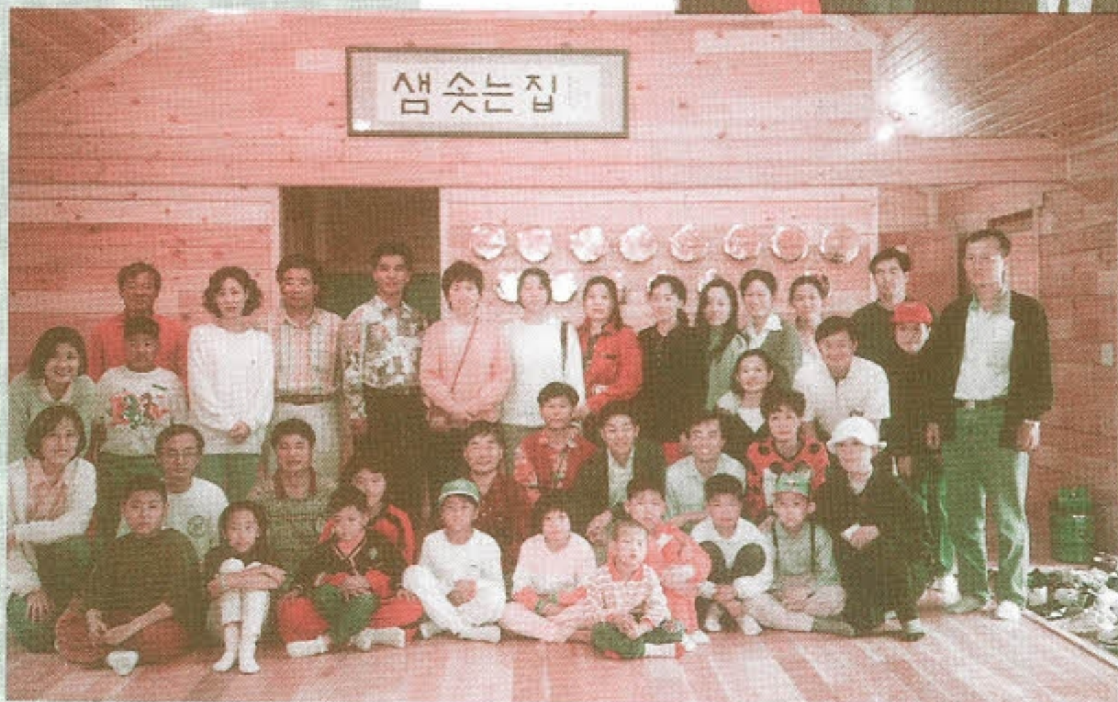
▶ 김치 -기념촬영-