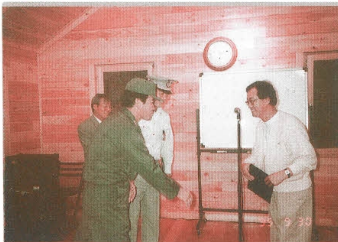
▶ 응급 상황은 저희에게 말기십시오 -연천소방소, 연천의용 소방대와 자매결연