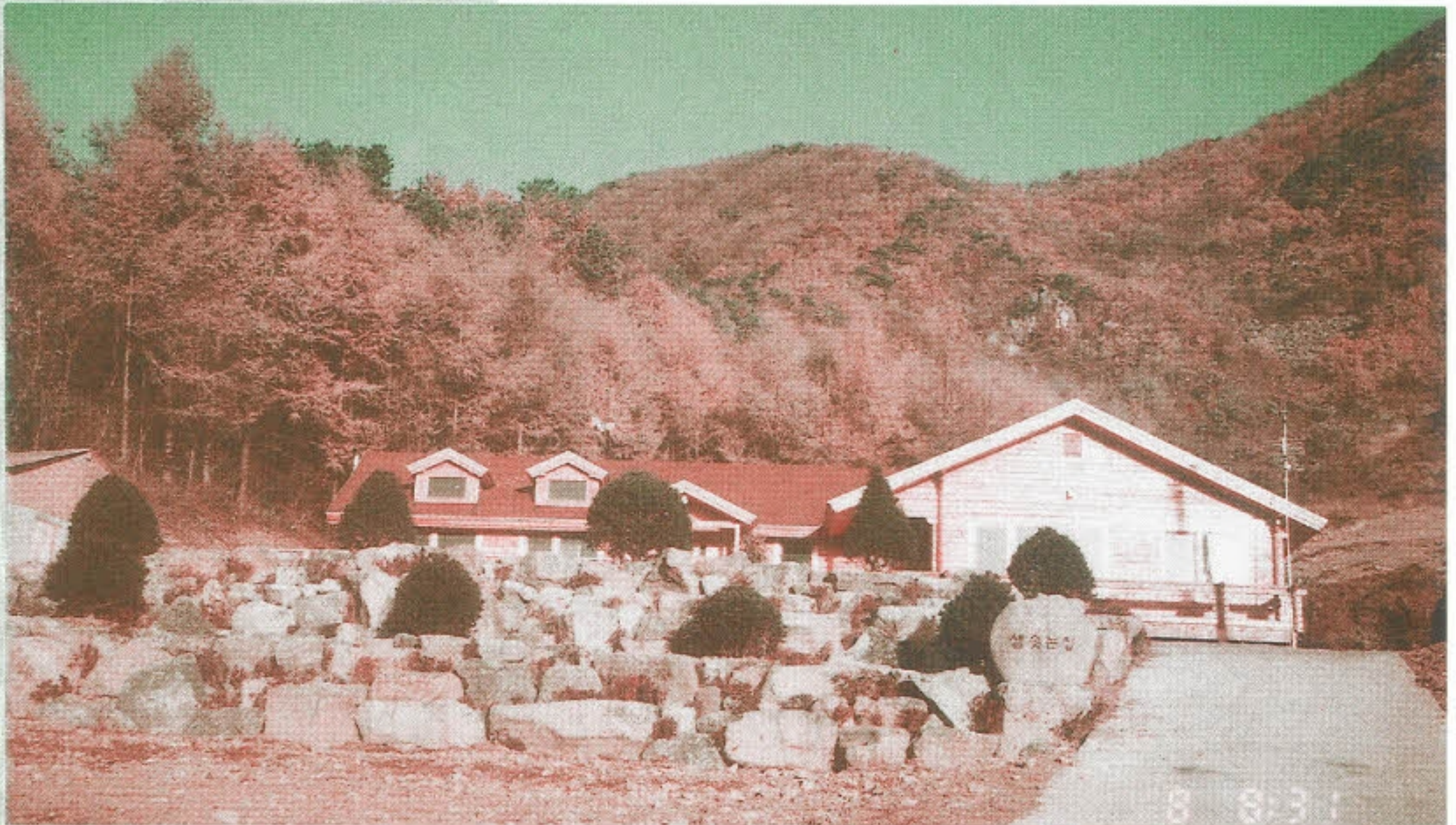
▶ 조경을 마치고 -한영건설산업 대표 김영환 후원