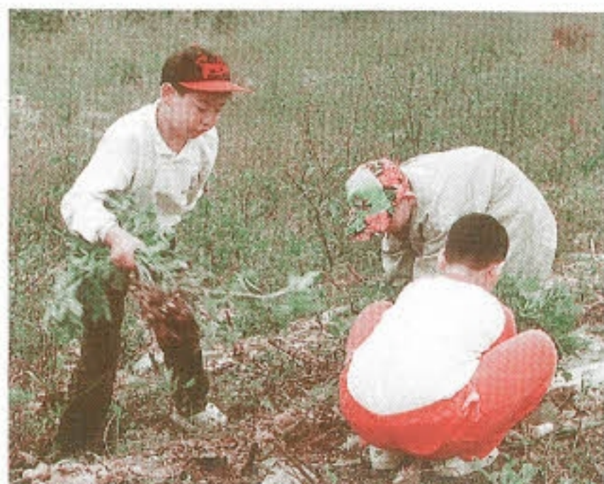
▶ 땡콩캐기 -누구께 많이 달렸나-