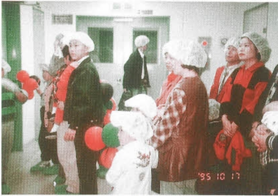
▶ 한국 그락소 웰컴 안산공장 방문

백혈병어린이들은 치료기간에 많은 활동의 제약을 받는다. 비록 짧은 일정이지만 야외 나들이는 이 어린이들에게 커다란 기쁨과 힘이 되었다.