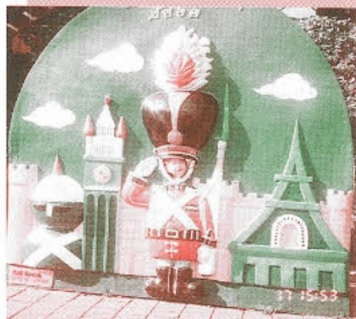
▶ 경례- 씩씩한 어린이 조병철입니다.