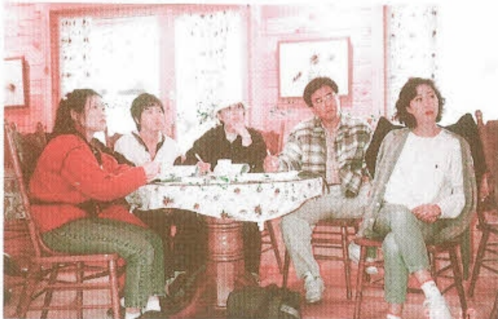
▶ 아이가 백혈병에 걸렸을 때부터 지금까지의 경험과 지혜를 나누고 있는 부모님들