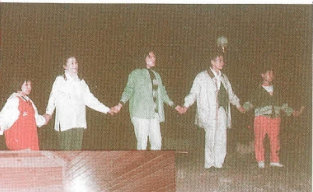
▼ 둥글게 하나되어