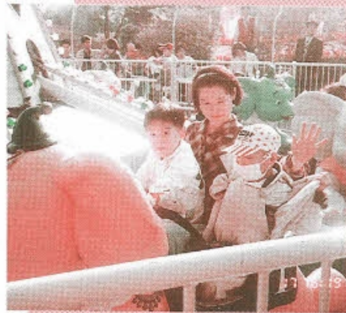
▶ 용인자연농원 방문