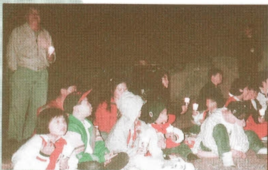
▶ 완치를 기원하는 촛불의식

제4회 푸른우리마을 가족캠프가 경기도 연천 '샘솟는 집'에서 9월30일 10월1일 1박 2일로 개최되었다.