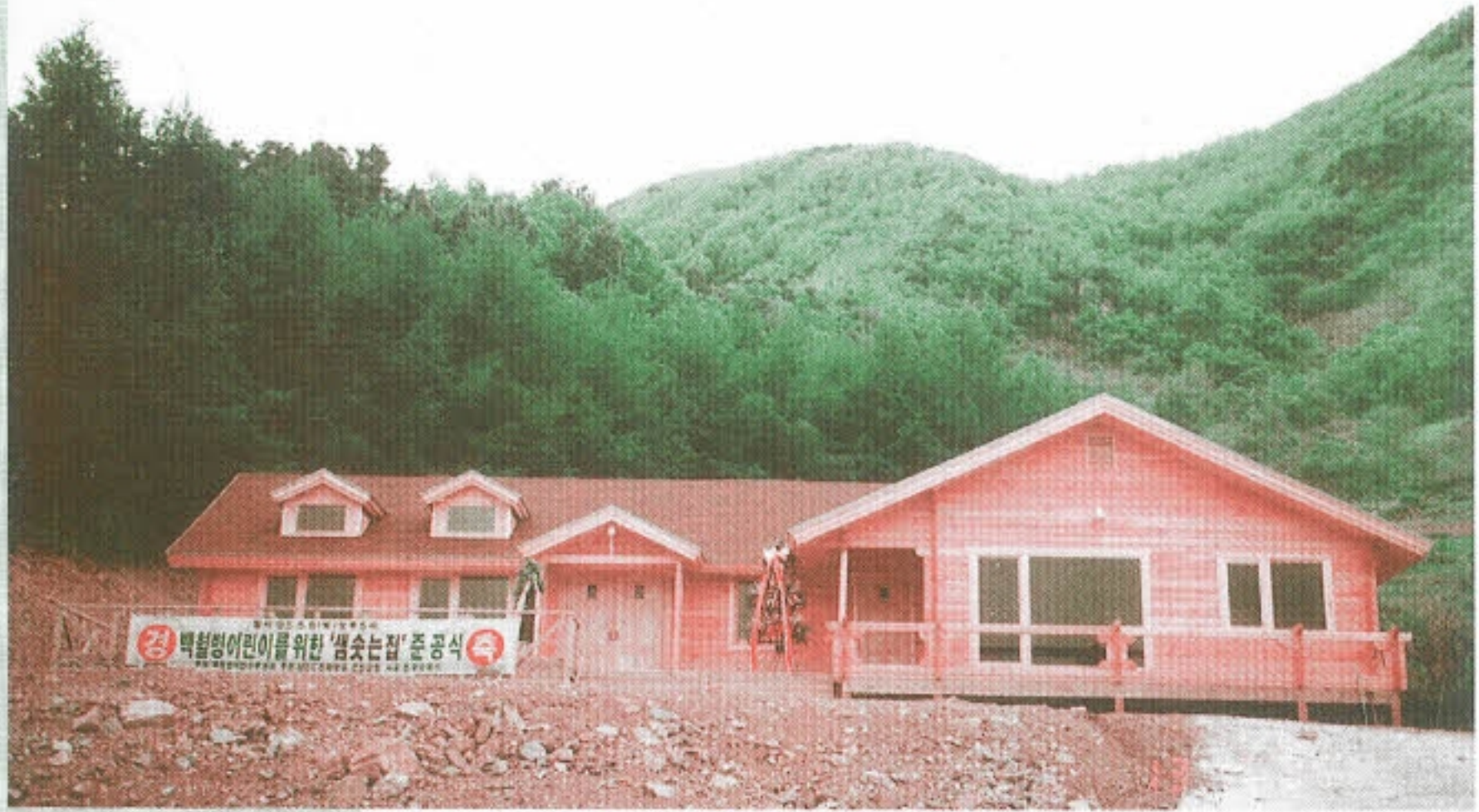
▶ 샘솟는 집 전경

MBC 문화방송 '어린이에게 새생명을!' 특집프로를 통하여 백혈병어린이와 가족들을 위한 휴양시설인 '샘솟는집'이 경기도 연천군 연곡읍 고문리 148-1에 마련되었다.