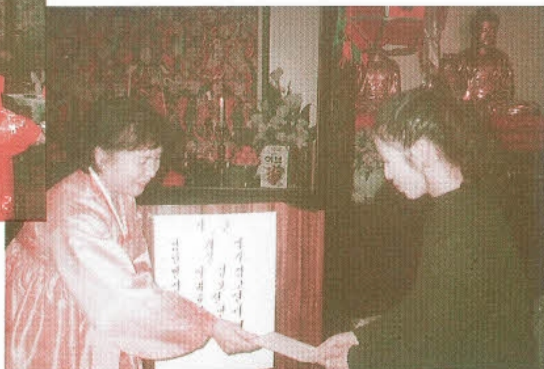
▶ 해마다 사랑을 나누어 주는 한국불교사회봉사회