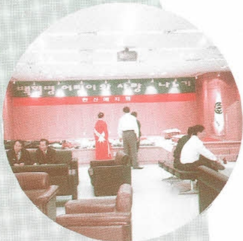
▶ 백혈병어린이와 사랑나누기 - 예지회(한신공영 여직원회)