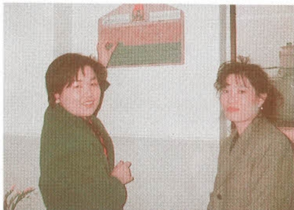
▶ 희망의 집 사랑의 벽돌쌓기 - 장기신용은행 아름회