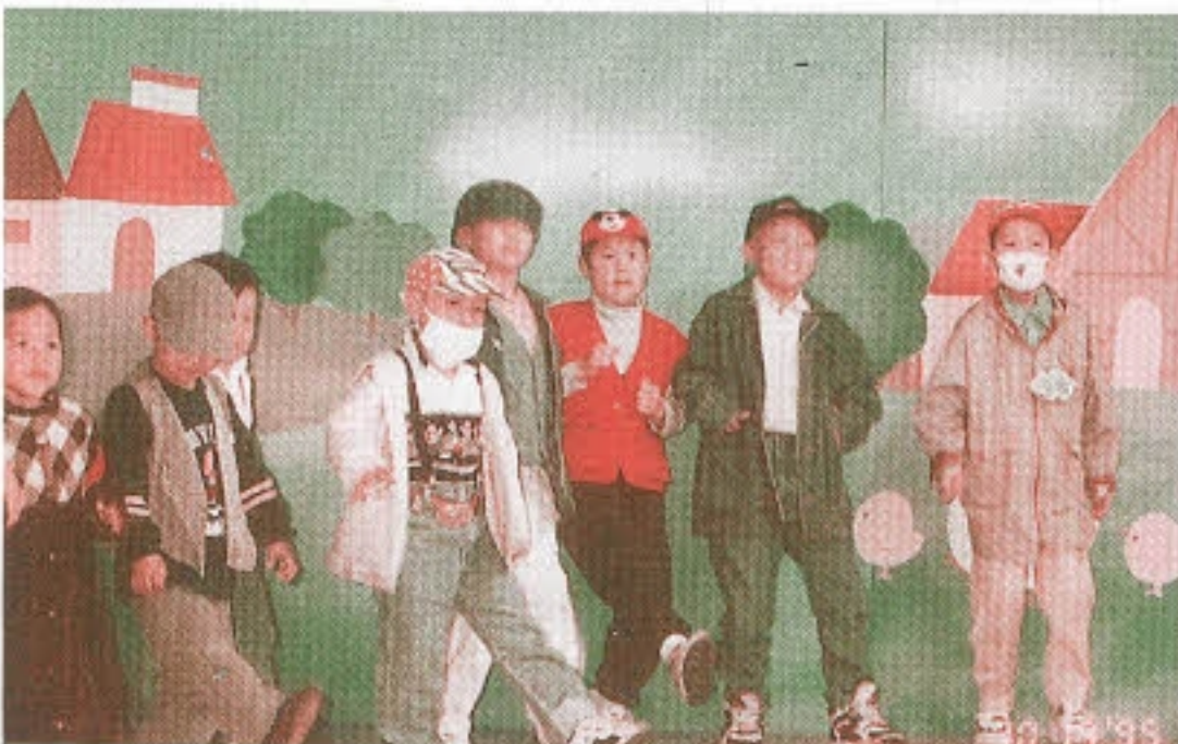
▶ 왜 신난다. - 삼성어린이 박물관 견학