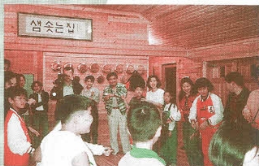
▶ 우리모두 하나 되어