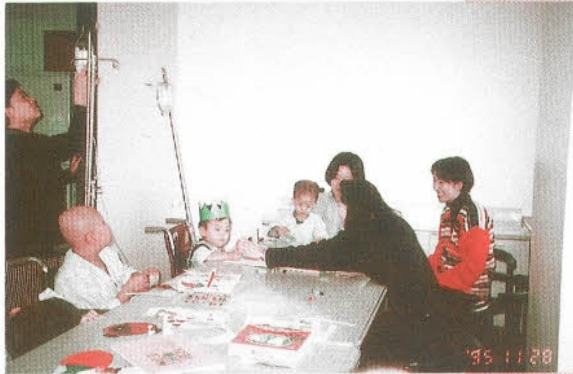
▶ 예쁜 꿈을 그려요 - 제일기획 사회공헌팀 (매주 화요일 백혈병어린이 그림지도)