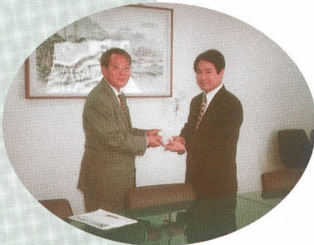
▶ 쌍용제지 임직원일동