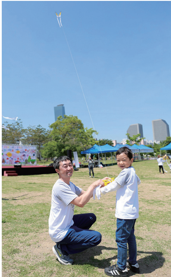
날 수 있어요! 날 수 있어요!