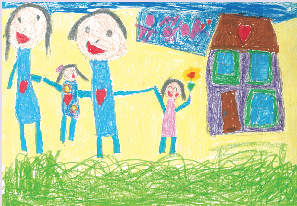
유성아_행복한 우리가족(소아암 어린이 꿈 그림·글 공모전 수상작)